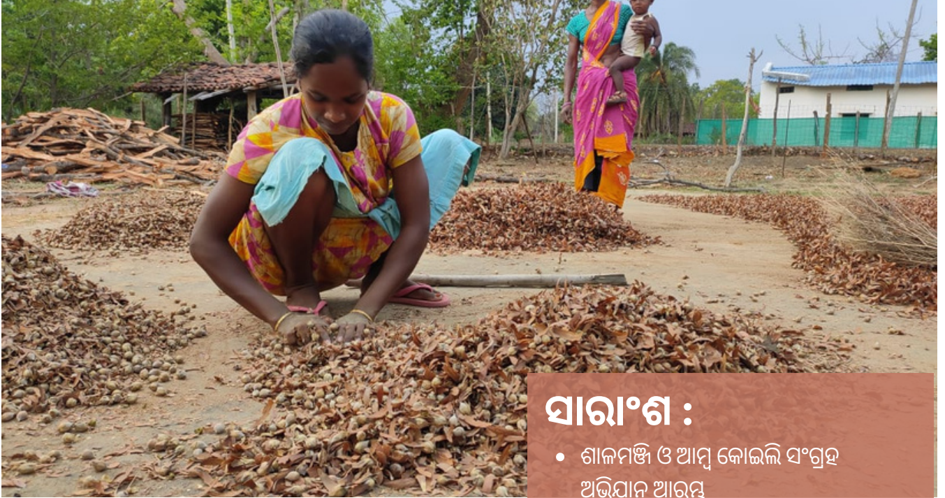
ଶାଳମଞ୍ଜି ଓ ଆମ୍ବ ଟାକୁଆ ସଂଗ୍ରହ ପାଇଁ ଅଭିଯାନ