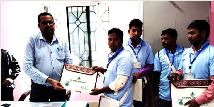
ମୟୂରଭଞ୍ଜର ଯଶପୁର ତହସିଲ