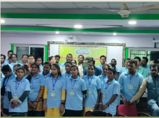
ନୟାଗଡ଼ର ଗଣିଆ ବ୍ଲକ୍