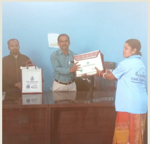
ମୟୂରଭଞ୍ଜର ଶୁକୁଳି ତହସିଲ

ବିଭିନ୍ନ ଜିଲ୍ଲାରେ ବଣ୍ଟାଯାଇଥିବା ଏଫ୍ଆର୍ଏ କିଟ୍