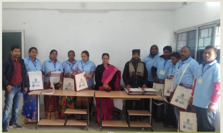
ମୟୂରଭଞ୍ଜର ରଠୁଆଁ ତହସିଲ