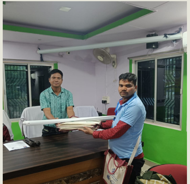
ନୟାଗଡ଼ର ଦଶପଲ୍ଲୀ ବ୍ଲକ୍