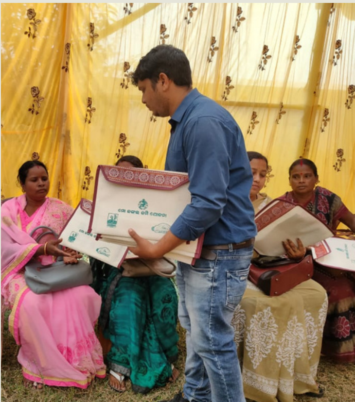
ମୟୂରଭଞ୍ଜର କରଞ୍ଜିଆ ତହସିଲ