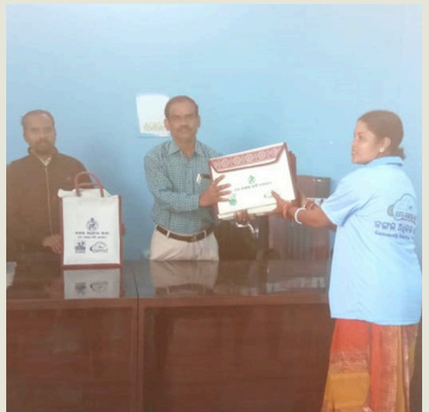
ମୟୂରଭଞ୍ଜର ଶୁକୁଳି ତହସିଲ

ବିଭିନ୍ନ ଜିଲ୍ଲାରେ ବଣ୍ଟାଯାଇଥିବା ଏଫ୍ଆର୍ଏ କିଟ୍